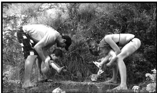
"Mira, como yo" Accesit 2014