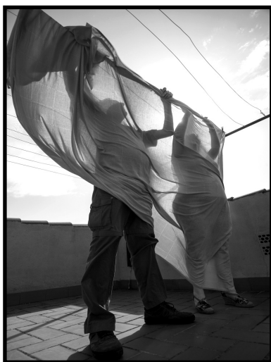
"Igualdad" 3º Premio - 2014